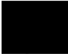
Lýdia Šuchová riaditeľka Agentúry na podporu výskumu a vývoja