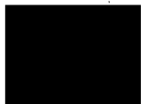
Lýdia Šúchová riaditeľka Agentúry na podporu výskumu a vývoja