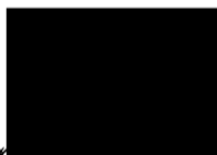
Lýdia Šuchová riaditeľka Agentúry na podporu výskumu a vývoja