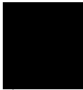
Lýdia Šuchová riaditeľka Agentúry na podporu výskumu a vývoja